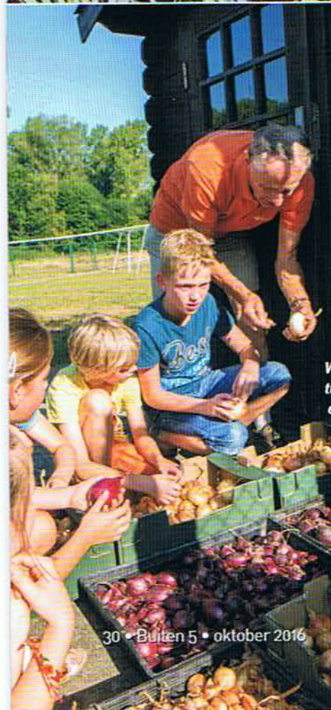
Wie kent het verschil tussen een sjalot en een 'juin'?