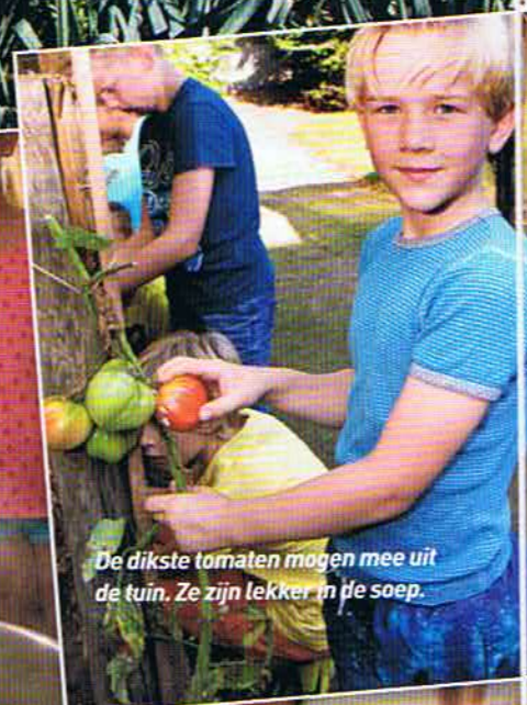
De dikste tomaten mogen mee uit de tuin. Ze zijn lekker in de soep.